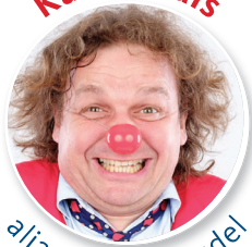
alias Doktor Dudel