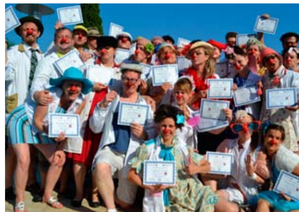
Zdravotní klauni získali certifikát z berlínské univerzity Steinbeis Hochschule Berlin, na mezinárodním institutu pro Zdravotní klaunování.