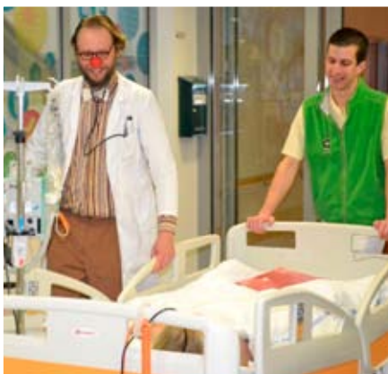
Zahájili jsme nový program NOS! (Na operační sál!), při kterém zdravotní klauni doprovází dětské pacienty a jejich rodiče cestou na operační sál.